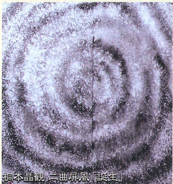
桐本晶観 二曲屏風「誕生」