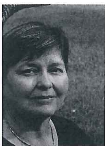
スーザン・オズボーン Susan Osborn

アメリカ・ミネソタ州生まれ。天与の歌声と才能を持ち、日本では「ヒーリングの女王」の異名で親しまれているシンガー、スーザン・オズボーン。日本や世界のスタンダード曲やクラシックの名曲にオリジナルの英詞をつけた彼女の歌は、コマーシャルや映画のサウンドトラックにも数多く採用されています。日本への来日回数も50回を超える親日家で1992年、日本の名曲を英語詞で録音した名盤『和美』で日本レコード大賞アルバム企画賞を受賞。1998年、長野オリンピック、パリンピックにて「上を向いて歩こう」を熱唱。懐かしい日本の唱歌や童謡を伸びやかに歌い、世界の人々の心に響かせています。2007年自身が体験した桜の奇跡を綴ったフォトエッセイ「桜の樹が教えてくれた」を上梓。自然から受け取る勇気やメッセージを多くの人々と分かち合っています。