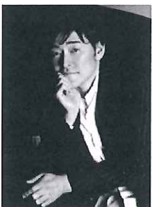
木原健太郎 Kentaro Kihara

アメリカ・ミネソタ州生まれ。天与の歌声と才能を持ち、日本では「ヒーリングの女王」の異名で親しまれているシンガー、スーザン・オズボーン。日本や世界のスタンダード曲やクラシックの名曲にオリジナルの英詞をつけた彼女の歌は、コマーシャルや映画のサウンドトラックにも数多く採用されています。日本への来日回数も50回を超える親日家で1992年、日本の名曲を英語詞で録音した名盤『和美』で日本レコード大賞アルバム企画賞を受賞。1998年、長野オリンピック、パリンピックにて「上を向いて歩こう」を熱唱。懐かしい日本の唱歌や童謡を伸びやかに歌い、世界の人々の心に響かせています。2007年自身が体験した桜の奇跡を綴ったフォトエッセイ「桜の樹が教えてくれた」を上梓。自然から受け取る勇気やメッセージを多くの人々と分かち合っています。