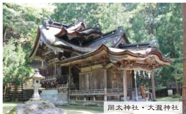
岡太神社・大瀧神社