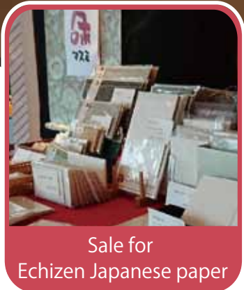
Sale for Echizen Japanese paper

In recent years, Echizen Torinoko Paper made in Echizen City, blessed with nature and Shimizu, has been registered as an important intangible cultural heritage.