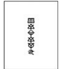
朗読用テキスト (奉呈文～4アヤ) 500円(税抜)