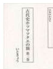
第4巻 (青森・秋田・仙台・長野) 1,400円(税抜)