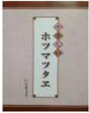
奉呈文～4アヤ 2,000円(税抜)

ホツマツタエは全部で40のお話(ホツマでは「アヤ」という)で構成されています。そのすべてに関し、原文・ヨミ・訳をまとめているのが、「やさしいホツマツタエ」シリーズです。是非朗読を通してホツマツタエを楽しんで頂けたらと思います。