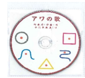
アワの歌 CD 500円(税抜)