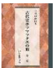
第1巻 (伊勢・富士山・筑波山) 2,000円(税抜)

著者いときょうが松本善之助氏著「秘められた日本古代史ホツマツタへ」(毎日新聞社発行)を東京・日本橋丸善で偶然手にしたことから始まった古代史ホツマツタエの旅。各地に伝わる伝承や神社に残されている由緒等とホツマツタエを比較検討しながら日本各地を旅した記録です。旅の様子を楽しみながら、新たな観点でこの国の成り立ちを理解していくことができます。