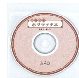
朗読用CD (奉呈文～4アヤの朗読音声収録) 500円(税抜)