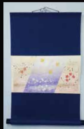
ピタット軸にも収まります！