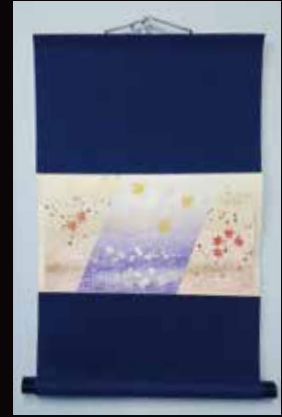
ピタット軸にも収まります！